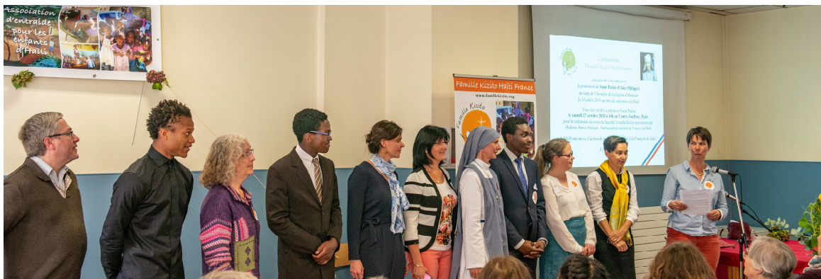
Le Conseil d'Administration, de gauche à droite :

Impression : par nos soins