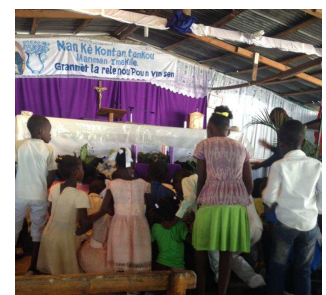
Enfants devant la couronne de l'Avent

Je vous embrasse tous. Merci pour vos prières. » Sœur Paësie